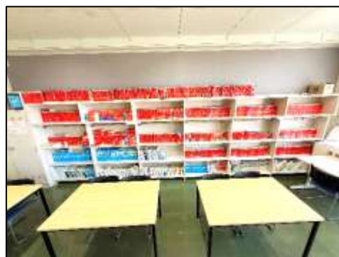
後ろの棚には赤本がずらり