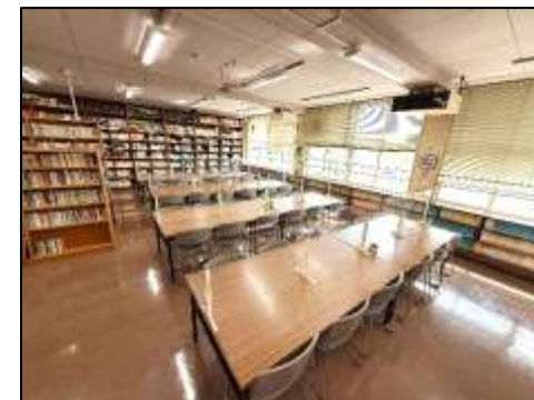
中の様子 (自習スペース)