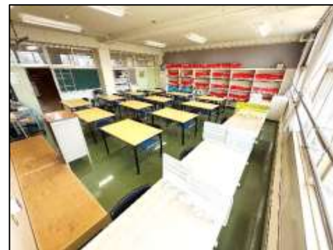
講義室 E の様子(窓側から)