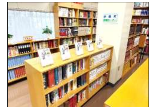
小論文対策のコーナーも