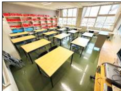
講義室 E の様子(廊下側から)