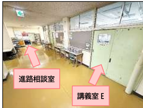
講義室 E と進路相談室の場所

注意：飲食はできません。おしゃべりも厳禁です。場所取りや占領などもしないように。