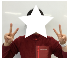
N先生 大阪出身。大阪の魅力を熱く語つてくれる体育教師。

・来年三月に行く四年生へ ↓見学旅行前に事前学習を入念におこなつてください。歴史を学ぶ際に、知識がある状態で行くのと何も知らずに行くのでは学びの深さも面白さも違います。