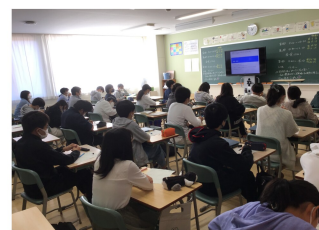
▲教室内視聴の様子

最近マンガやアニメが注目を浴びている。近頃流行ったものといえば「鬼滅の刃」や「呪術廻戦」などである。また、「約束のネバーランド」なども流行しているといえるだろう。筆者は、これはコロナ禍と関係があると考えている。最近流行しているジャンルに「ダークファンタジー」というものがある。ダークファンタジーとはそもそも、一般的なファンタジー、つまり夢や希望、冒険などを押し出したものではなく、主人公に不利な世界を中心に描くようなものである。さらに敵と戦い、世の中の不条理を変えていく主人公を描くことによって、自分と重ねて勇気づけられる人が続出しているのではないだろうか。また、巣籠り需要が増え