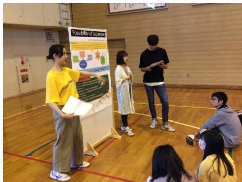
◀シモスターチャ交えて