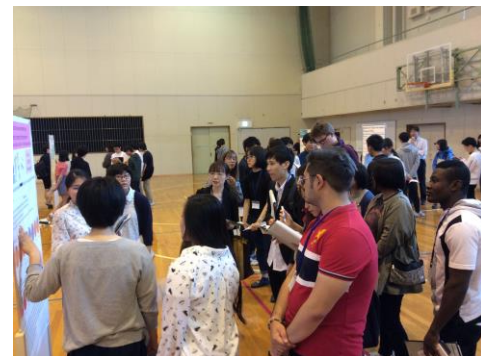
◀留学生に囲まれて