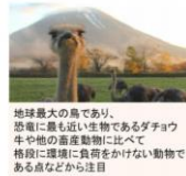
第2有島ダチョウ牧場

地球最大の鳥であり、恐竜に最も近い生物であるダチョウ牛や他の産産動物に比べて格段に環境に負荷をかけない動物である点から注目