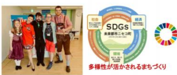
国際交流員と交流

川があるのは、森があるから 世界の森 = 伐採で急激に減少 日本の森 = 「使われない」ことでダメになっている