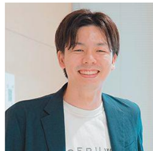
株式会社コエルワ CEO