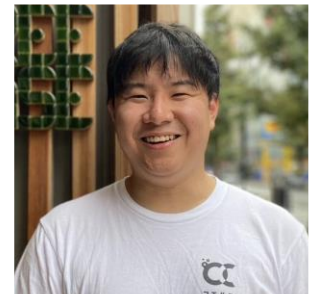
株式会社コエルワ C00