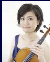
まえ なう 前 南有 (ヴィオラ)