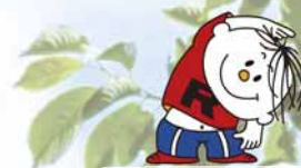
ラジオ体操イメージキャラクター ラジオ体操坊や(通称:ラタ坊)