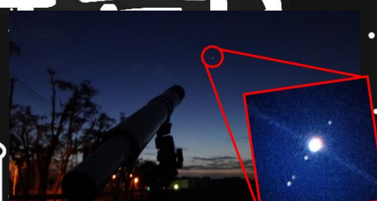
木星とガリレオ衛星の観測