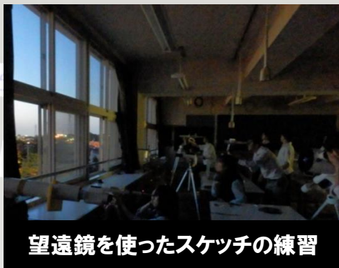
望遠鏡を使ったスケッチの練習