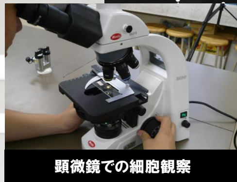
顕微鏡での細胞観察