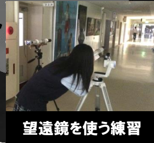
望遠鏡を使う練習