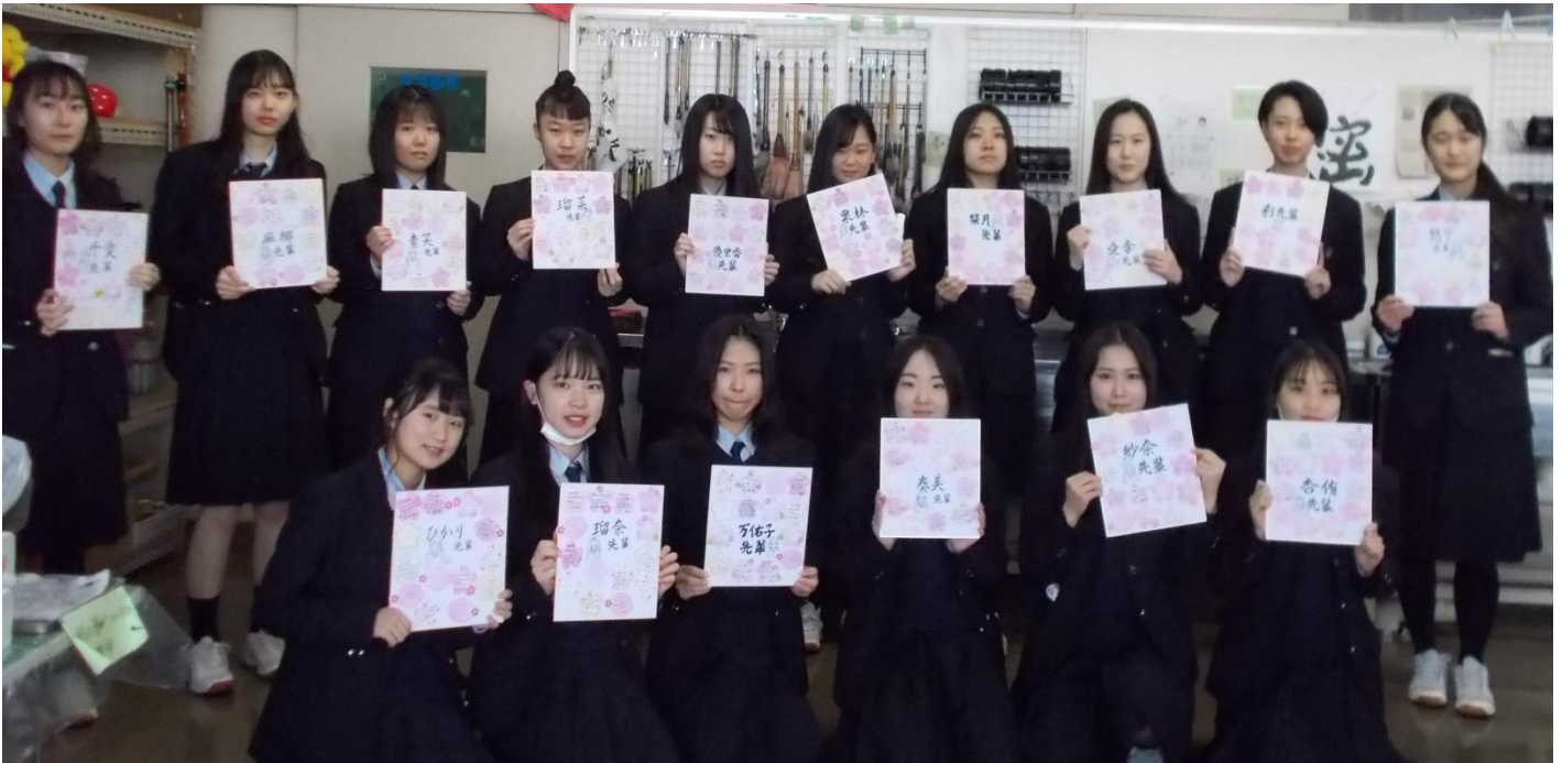
▲ 1, 2年生からの色紙をもって