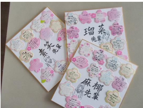
▲1, 2年生から3年生への色紙