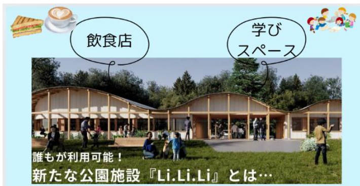
飲食店と、学びスペースがあるLiLiLi

今年度4月より「豊明高等支援学校×百合が原公園 P-PFI 事業の連携」が始まっています。10月25日、いよいよ百合が原公園に「カフェLiLiLi」開業！ということで、ここまでの歩みをダイジェスト版で御紹介します！