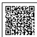
【家計急変・継続届出編】 2