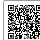
【家計急変・変更手続編2】