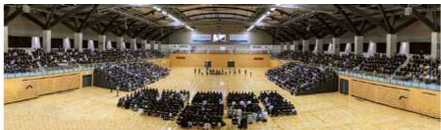
進路探究セミナー

社会人の講演と他の市立高校とのパネルディスカッションを通じ、将来について考え自分の進路に対する意識を深めます。事前・事後のワークショップも実施しています。